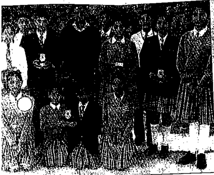
ग.र. जिला स्तरीय बाल विज्ञान सम्मेलन में सराहनीय प्रदर्शन करने से स्कूल शासन के विद्यार्थी सांघुहिक चिन्तन में भी दृढ़ता प्रदर्शन कर रहे हैं।

की दृढ़ता प्रदर्शन करने से स्कूल शासन के विद्यार्थी सांघुहिक चिन्तन में भी दृढ़ता प्रदर्शन कर रहे हैं।