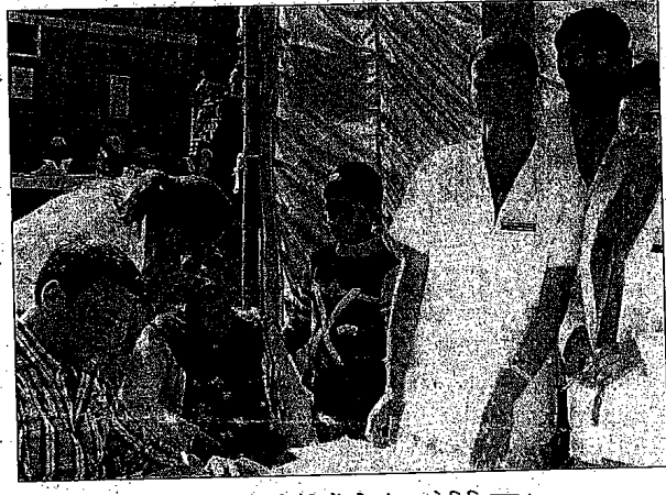
नगवाई में आयोजित चिकित्सा शिविर में रोगियों की जांच करते चिकित्सक।