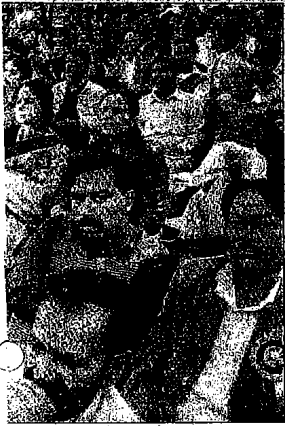
॥ में उपस्थित लोग।